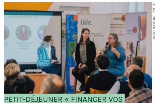
PETIT-DÉJEUNER « FINANCER VOS PROJETS À IMPACT : CONSEILS ET BONNES PRATIQUES POUR VOUS LANCER » - 13 OCTOBRE

Une trentaine de porteurs de projets à impact se sont retrouvés pour partager leurs bonnes pratiques afin de se lancer dans la recherche de financement.