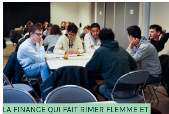
LA FINANCE QUI FAIT RIMER FLEMME ET ACTION - 14 NOVEMBRE

interventions presse ou lors d'événements