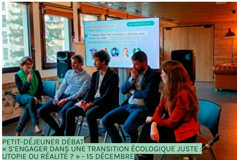
PETIT-DÉJEUNER DÉBAT « S'ENGAGER DANS UNE TRANSITION ÉCOLOGIQUE JUSTE : UTOPIE OU RÉALITÉ ? » - 15 DÉCEMBRE

A l'heure où la demande citoyenne pour plus de solidarité et d'écologie dans la finance augmente, FAIR proposait un débat avec ses adhérents sur la prise en compte de ces enjeux et le rôle de chacun.