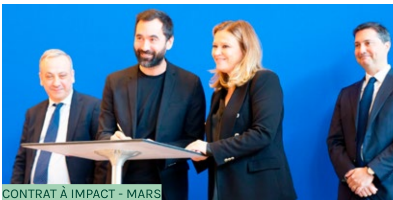
CONTRAT À IMPACT - MARS

Par ailleurs, afin de favoriser l'appropriation de cet outil par les acteurs, FAIR a organisé deux sessions d'information sur les contrats à impact à destination des porteurs de projets et des financeurs.