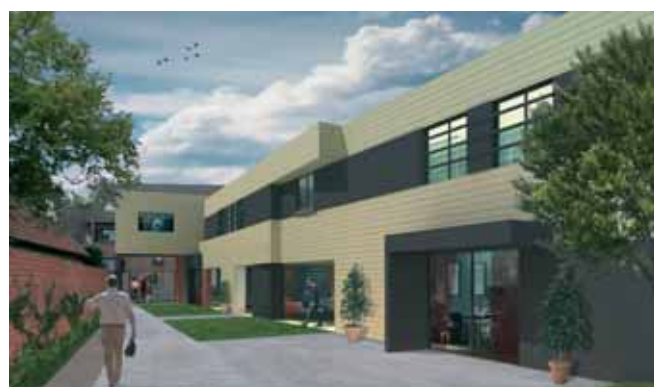
Projet Dumont Architecte